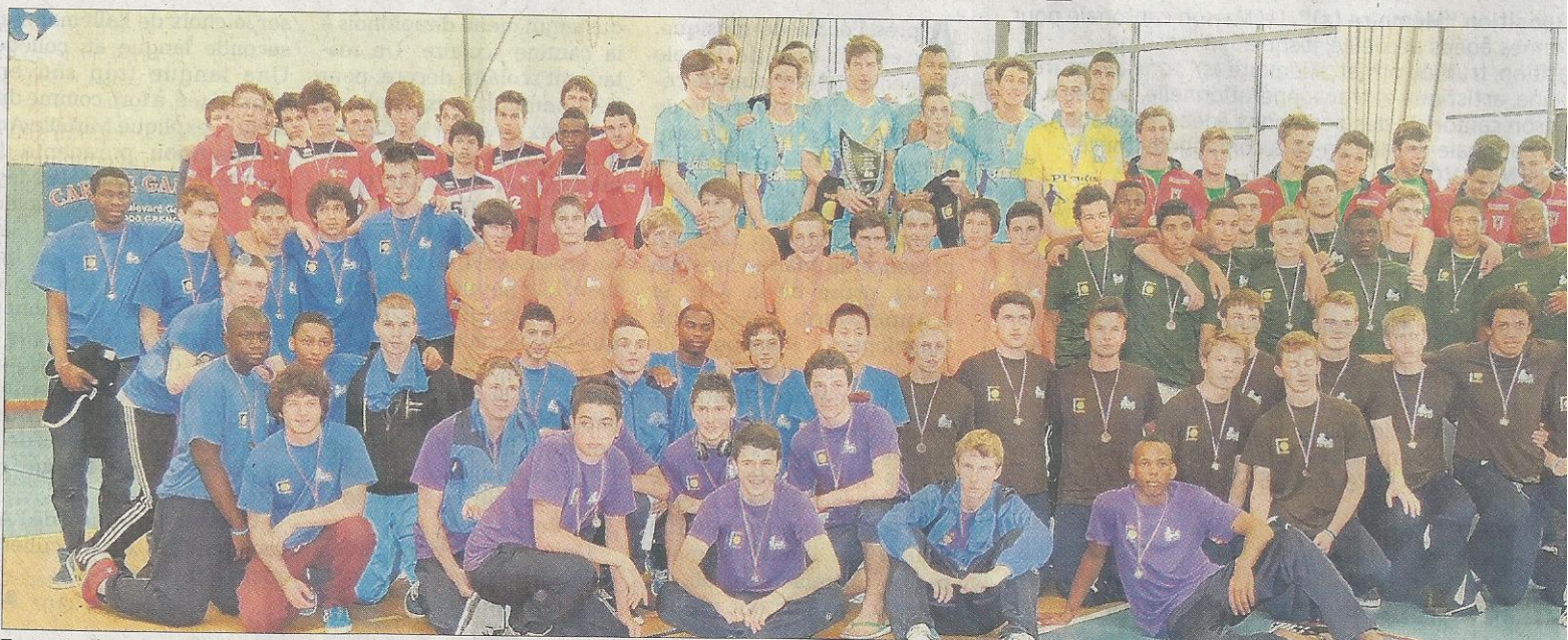
Toutes les équipes des finales de la Coupe de France cadets de volley-ball.